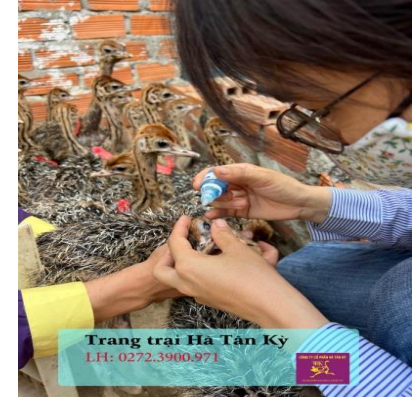
Nhỏ vaccin cho đà điểu

Tiktok: www.tiktok.com/@traigiongdadieu.htk