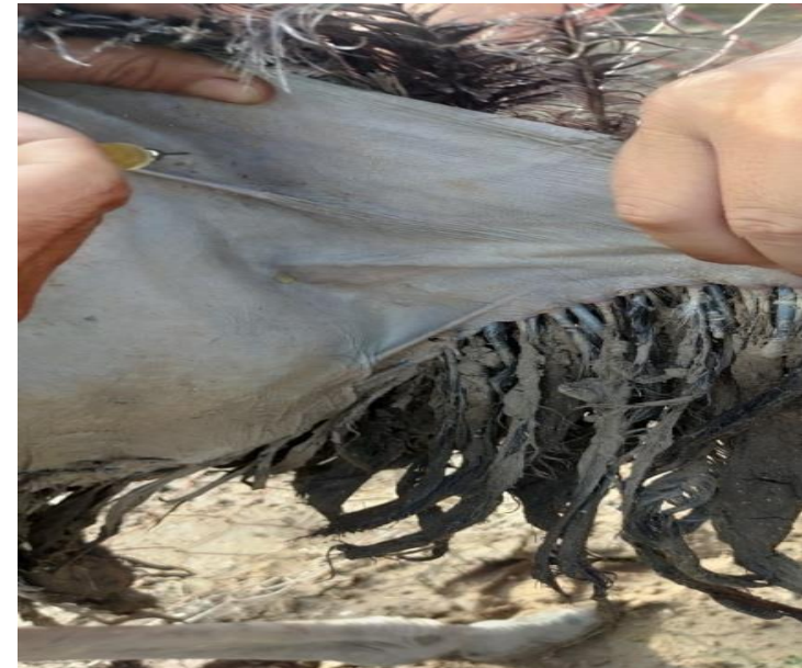
Tiêm bắp cho đà điều