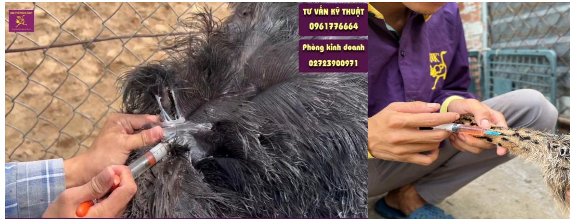
Tiêm dưới da cho đà điều