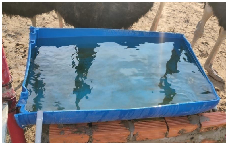
Hình 5. Máng nước cho đà điểu