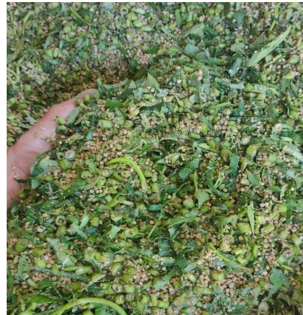
Hình 3. Chuẩn bị xay rau muống, cỏ cho đà điểu ăn