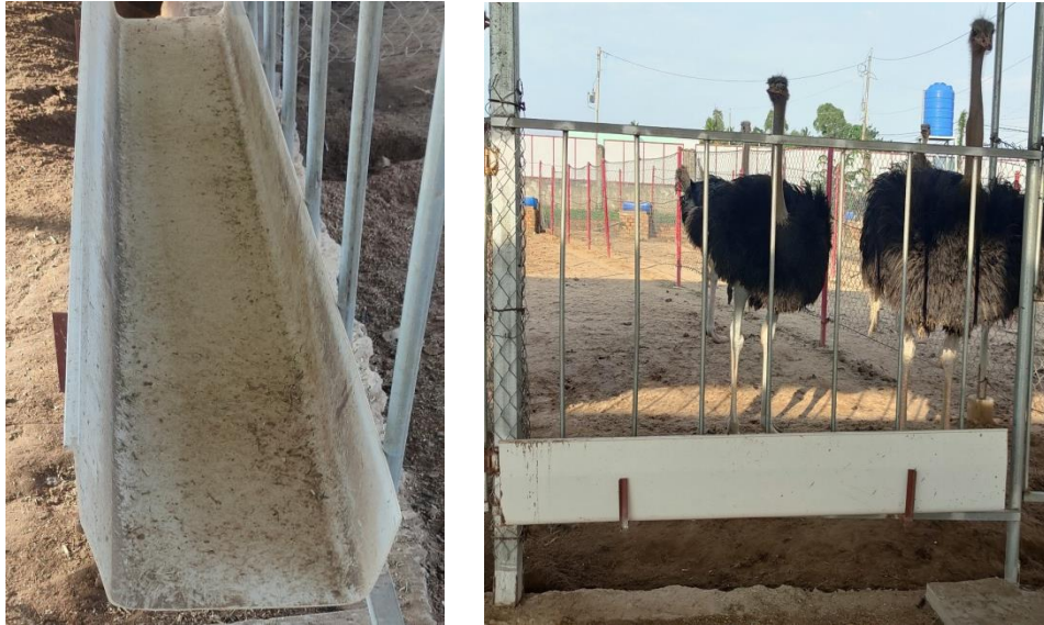
Hình 4. Máng ăn cho đà điểu