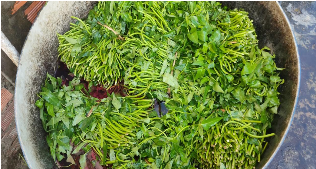
Hình 2. Rau muống được ngâm thuốc tím trước khi cho đà điểu ăn tránh bị ngộ độc

- Giai đoạn này đà điểu cần phải đáp ứng đủ đạm, các loại vitamin và chất xơ để đảm bảo tốt cho sự phát triển. Đà điểu là loài động vật ăn cỏ nên không thể thay thế hoàn toàn bằng thức ăn tinh.