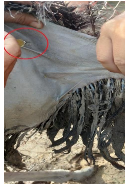
Hình 7. Vị trí tiêm bắp cho đà điểu