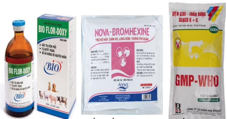
Hình 11. Thuốc điều trị đường hô hấp