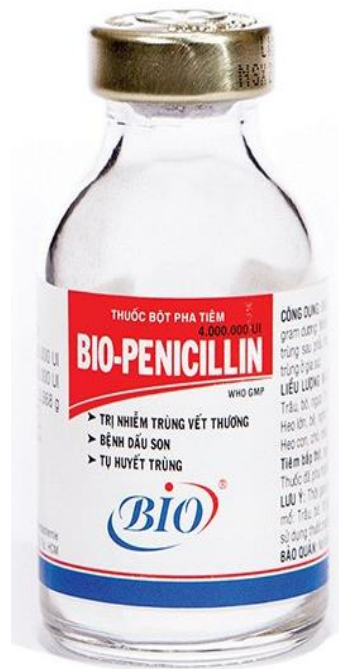
Hình 10. Kháng sinh điều trị Clostridium