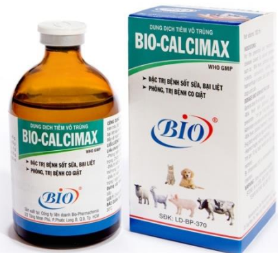
Hình 14. Canxi bổ sung cho đà điểu