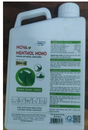
Hình 12. Thuốc hỗ trợ hô hấp