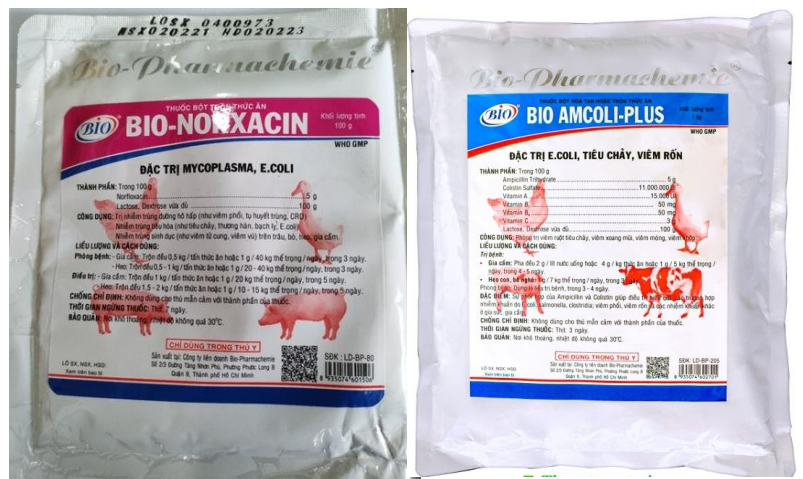
Hình 9. Các loại kháng sinh đặc trị tiêu chảy