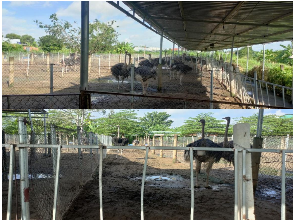
Hình 1: Chuồng nuôi đà điểu