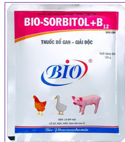
Hình 8. Thuốc điều trị táo bón