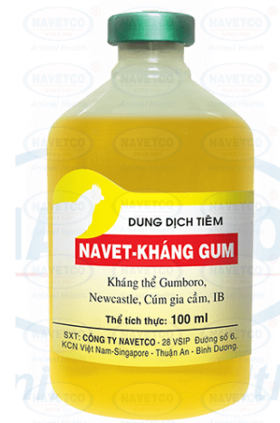
Hình 13. Kháng thể Newcastle, Gumboro, IB, Cúm gia cầm