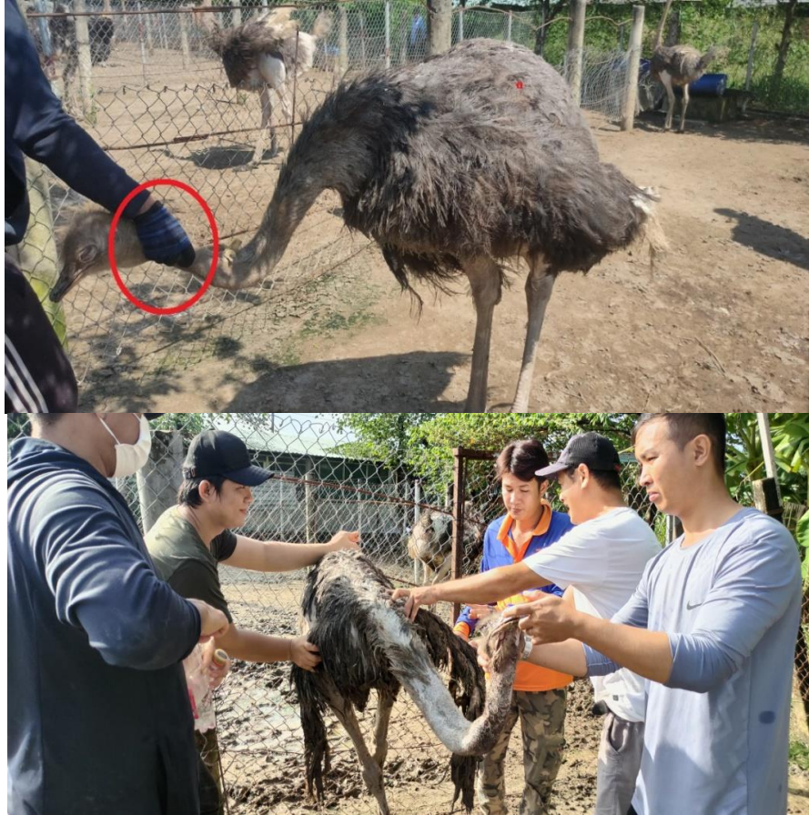
Hình 6. Cách bắt đà điểu