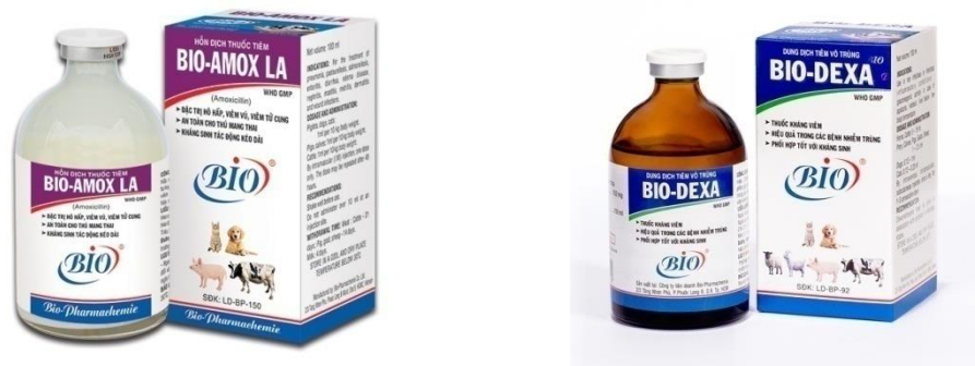
Hình 15. Thuốc điều trị viêm khớp cho đà điều